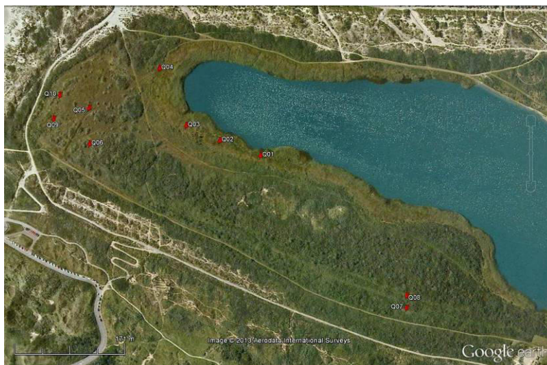
Overzichtkaart van het Kennemerstrand (luchtfoto sept. 2005) met de PQ's