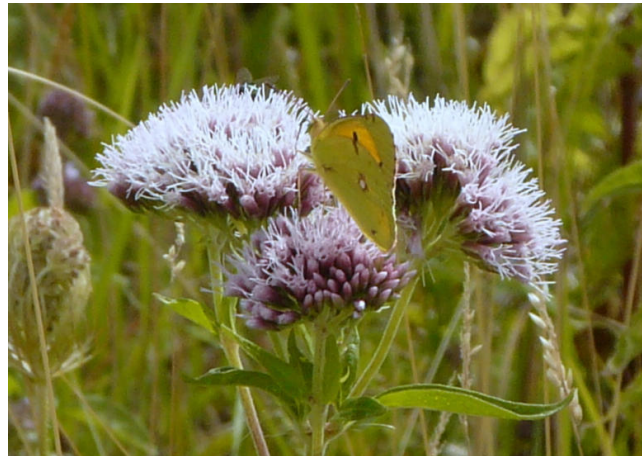
Oranje luzernevlinder op koninginnenkruid