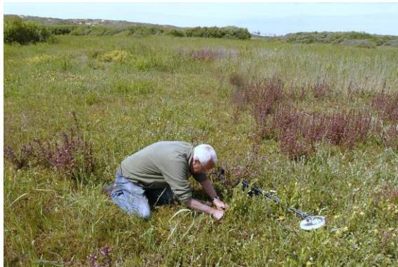
PQ hoekpunt teruggevonden met behulp van GPS en metaaldetector. Wel even uitgraven! PQ9 2013

moeraszoutgras (enkele planten). In PQ10 verschenen moeraskartelblad en grote ratelaar, beide soorten in een bedekking van ruim 10%. De vegetatie van de iets drogere kwadraten 5 en 6 was in 2013 vrijwel onveranderd. Nieuw waren een plant van groenknolorchis en enkele stengels van bevertjes in PQ6.